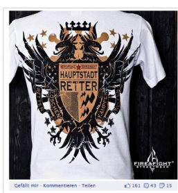
Gefällt mir · Kommentieren · Teilen 161 · 17 · 22