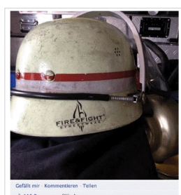
Gefällt mir · Kommentieren · Teilen 119 Personen gefällt das.